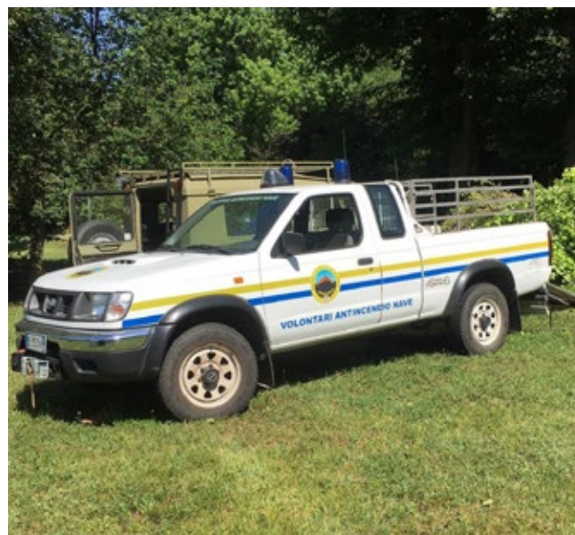
Pulizia roggia Minera nel tratto del parco del Garza a cura del gruppo SVAN Antincendio Nave

Data la situazione climatica attuale, sarà sempre più importante riuscire a organizzare in modo ottimale l'utilizzo di una risorsa preziosa quanto scarsa come l'acqua del nostro territorio, perciò, essendo ancora disponibili degli slot orari per le irrigazioni, invitiamo chiunque stia attingendo in maniera illecita o voglia poter utilizzare l'acqua del Minera a mettersi in contatto con il Consorzio o con il comune di Nave, al fine di gestire in maniera adeguata i bisogni di tutti, a fronte di un costo annuale di qualche decina di euro. Vale sicuramente la pena entrare nel Consorzio e agire da cittadini consapevoli e in regola.